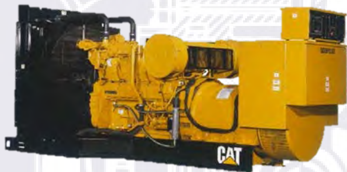
Генераторная установка показана с оборудованием, устанавливаемым по специальному заказу