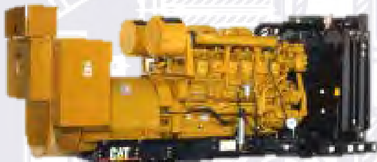
Генераторная установка показана с оборудованием, устанавливаемым по специальному заказу