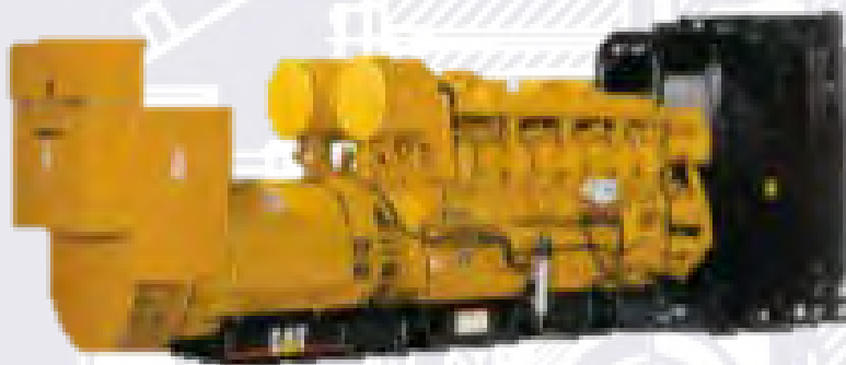
Генераторная установка показана с оборудованием, устанавливаемым по специальному заказу