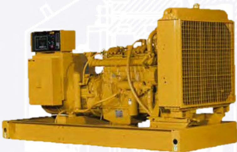
Генераторная установка показана с оборудованием, устанавливаемым по специальному заказу